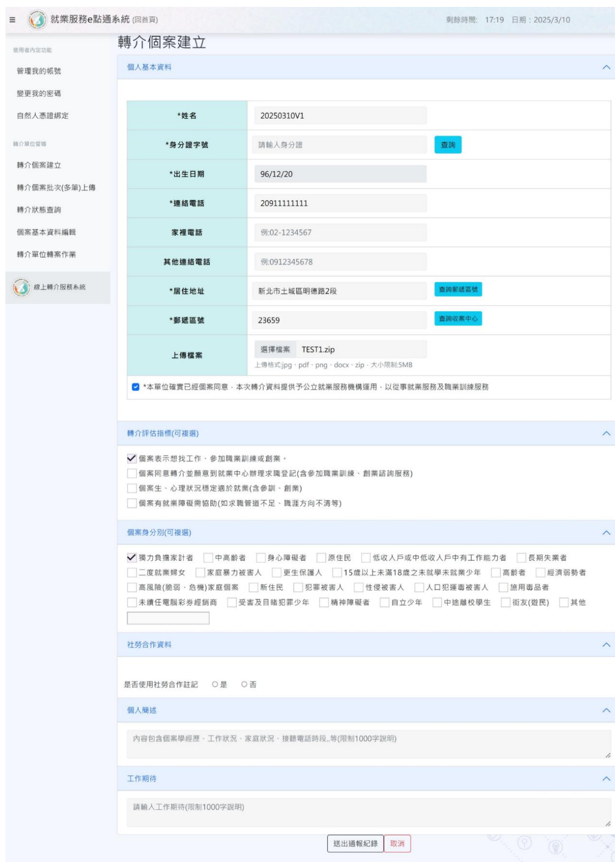
附表 2、就業服務 E 點通 個案轉介單