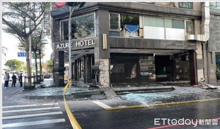
▲藍天麗池飯店結構受損嚴重。