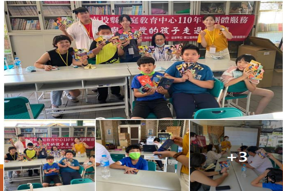
仁愛鄉清流部落團體服務方案－與親愛的孩子走過清流