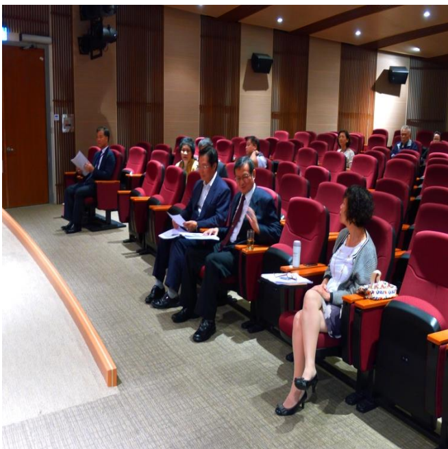
長官來賓蒞臨指導