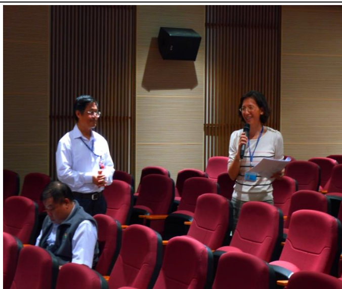
衛福部社家署會員發言