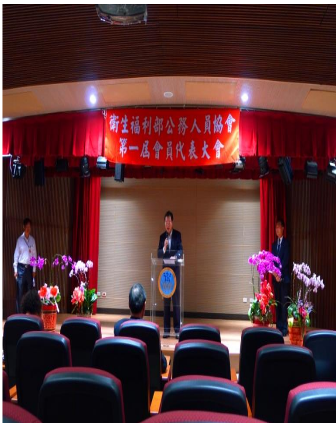
衛福部主任秘書林四海致詞