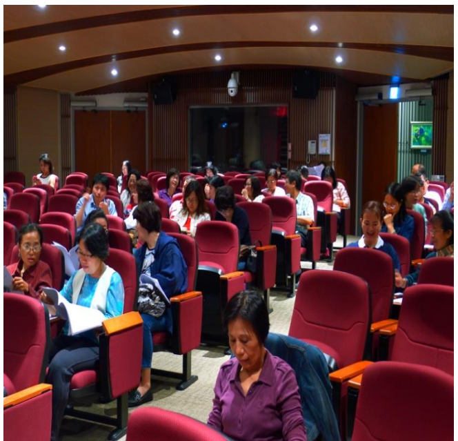
會前閱讀大會手冊