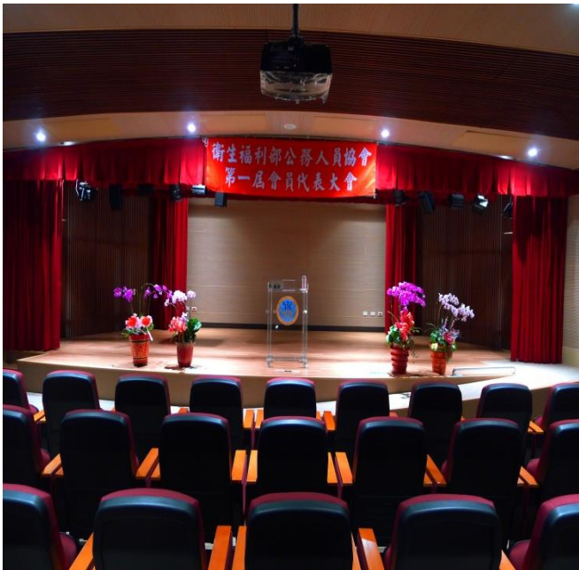
衛福部公務人員協會第一屆第二次會員代表大會，會員代表 104 人，本次計 88 人出席