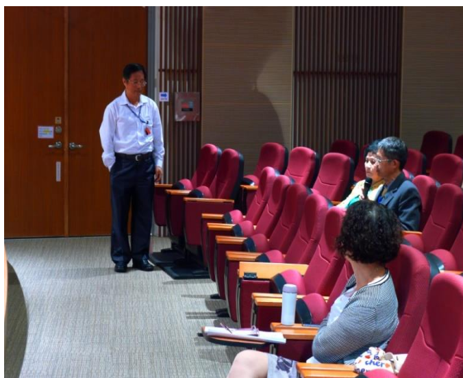
衛福部國健署會員發言