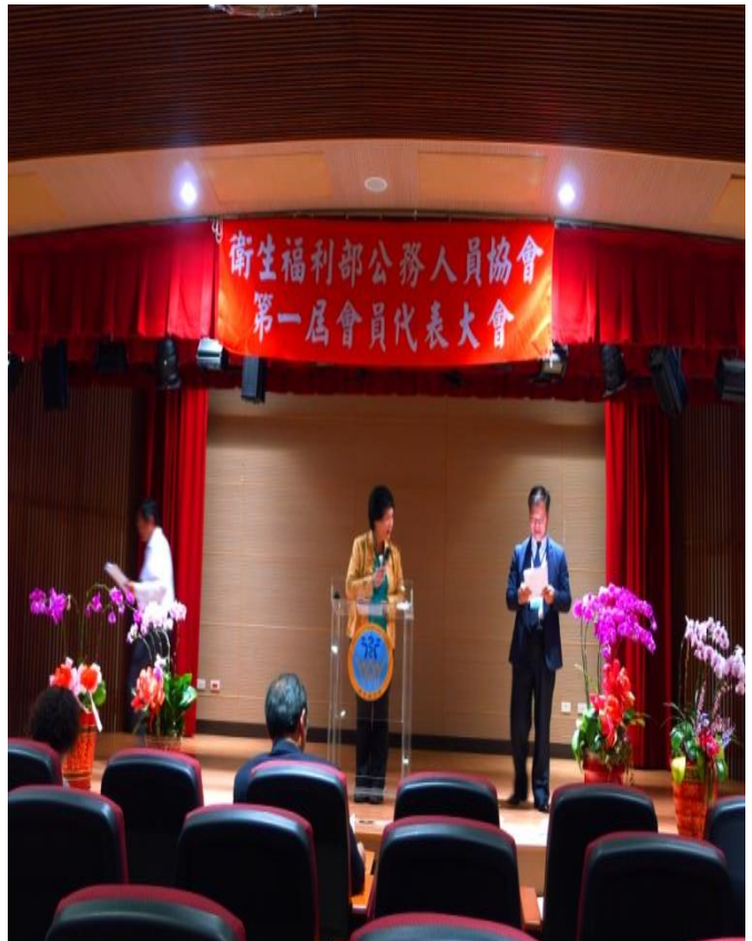
監事主席監察報告