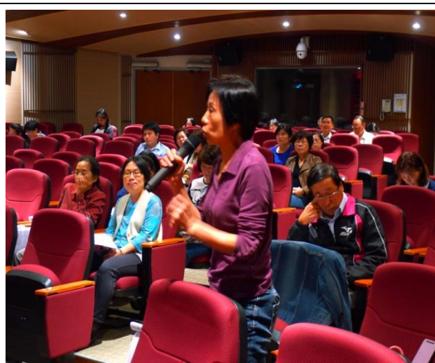
衛福部花蓮醫院會員發言