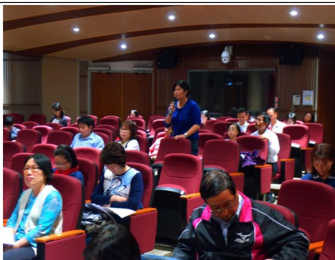
衛福部台北醫院會員發言