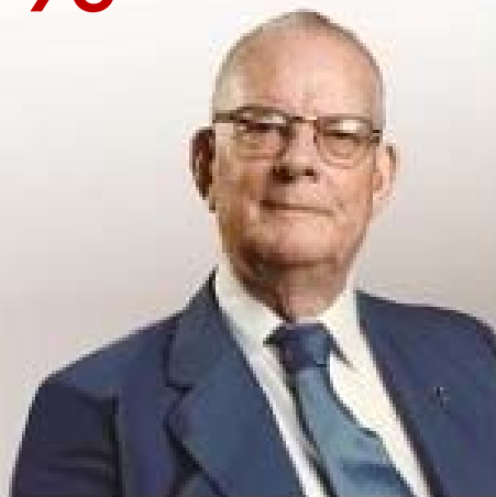
威廉·愛德华茲·戴明博士 ( Dr William Edwards Deming )