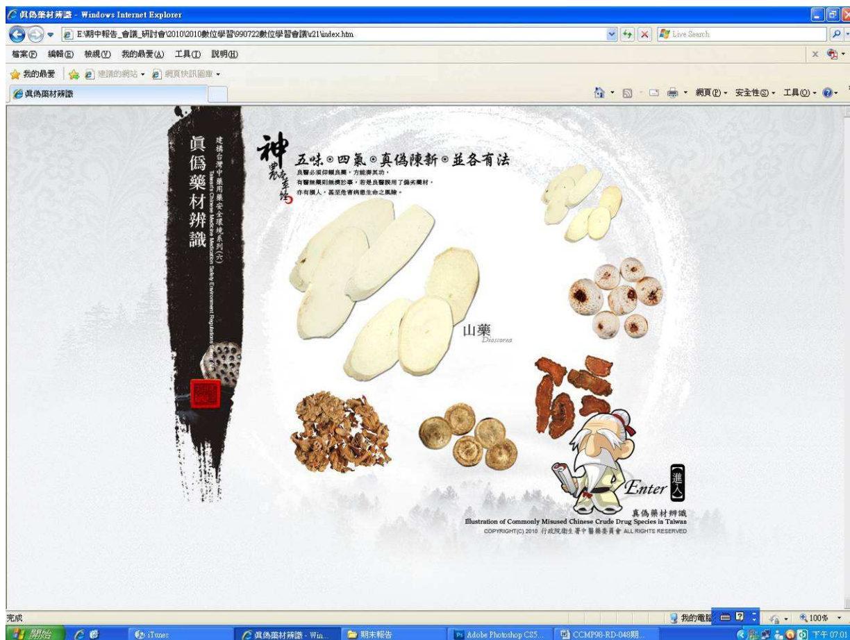
首頁 (第一次編審會議之初稿)