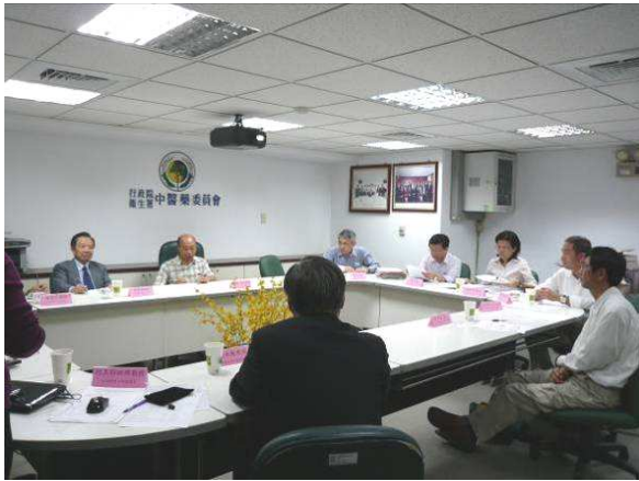
圖二、第一次「臺灣市售易混淆中藥辨識數位學習課程編審會議」相關活動照片 (99 年 3 月 5 日)