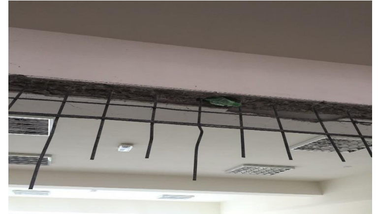
南勢社區多元照顧服務據點施工前