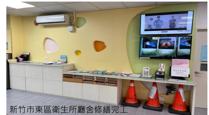
新竹市東區衛生所廳舍修繕完工