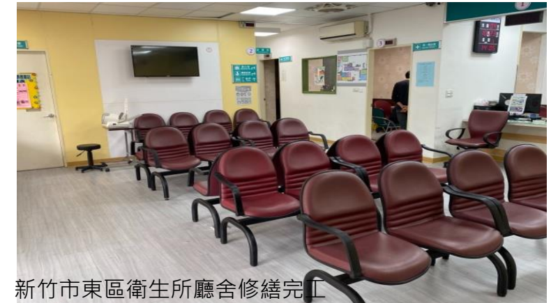
新竹市東區衛生所廳舍修繕完工