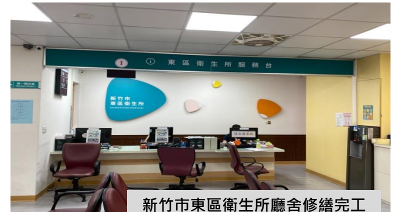
新竹市東區衛生所廳舍修繕完工