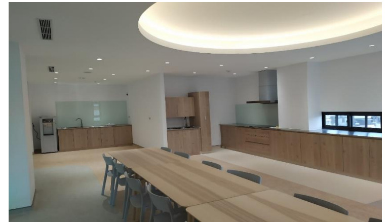
南勢社區多元照顧服務據點完工