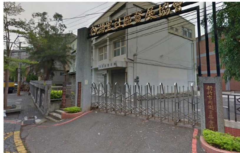
內湖社區活動中心施工前