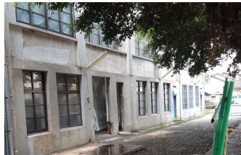
彰化縣田中國小閒置校舍原始照片