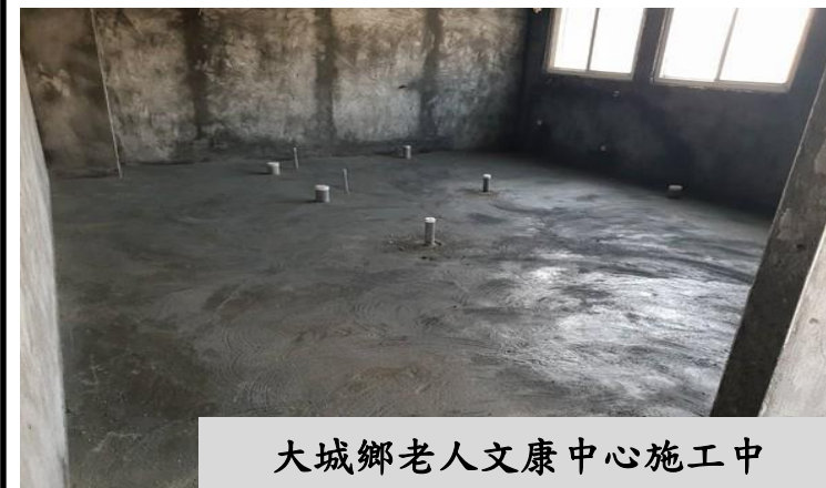
大城鄉老人文康中心施工中