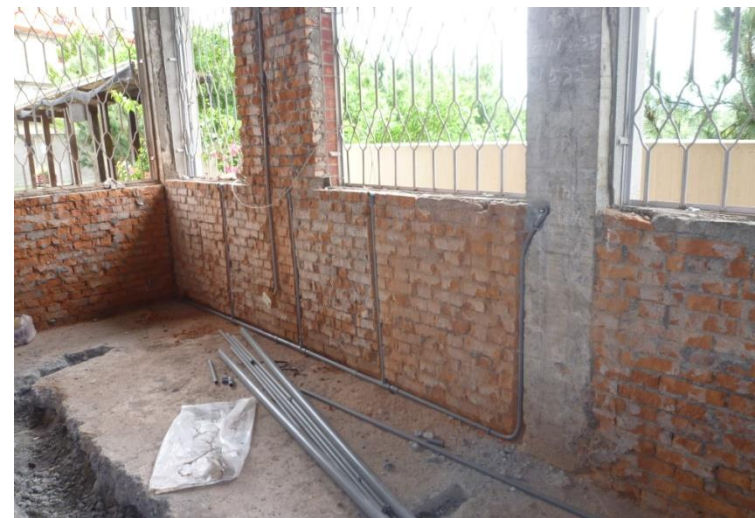
倡和社區活動中心內部環境整修施工