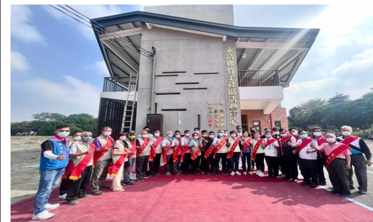
永靖鄉竹子社區活動中心落成完工