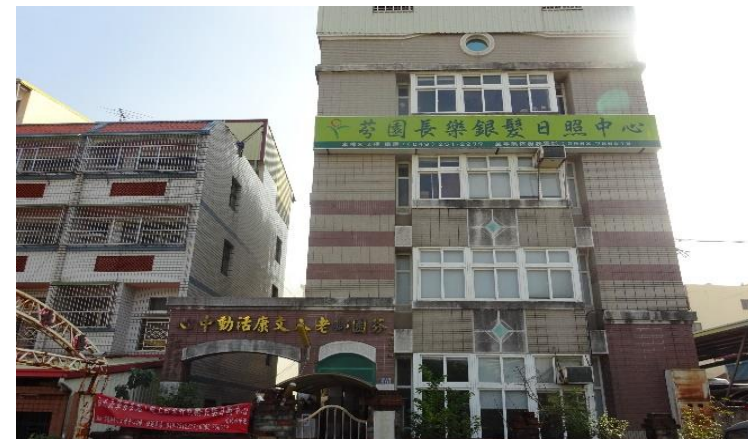
老人活動中心外觀