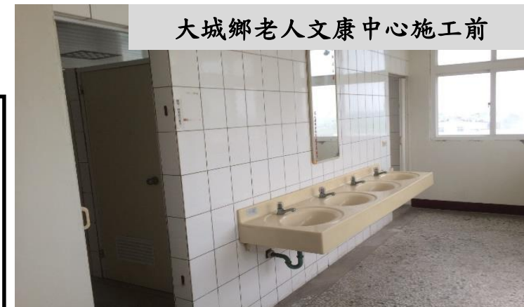
大城鄉老人文康中心施工前