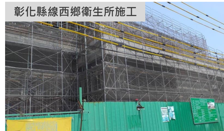
彰化縣線西鄉衛生所施工