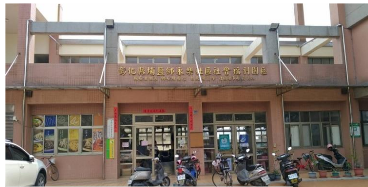
埔鹽鄉社會福利園區施工後