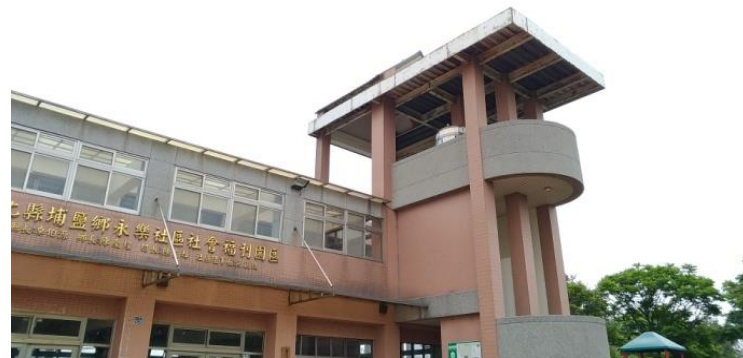
埔鹽鄉社會福利園區施工前