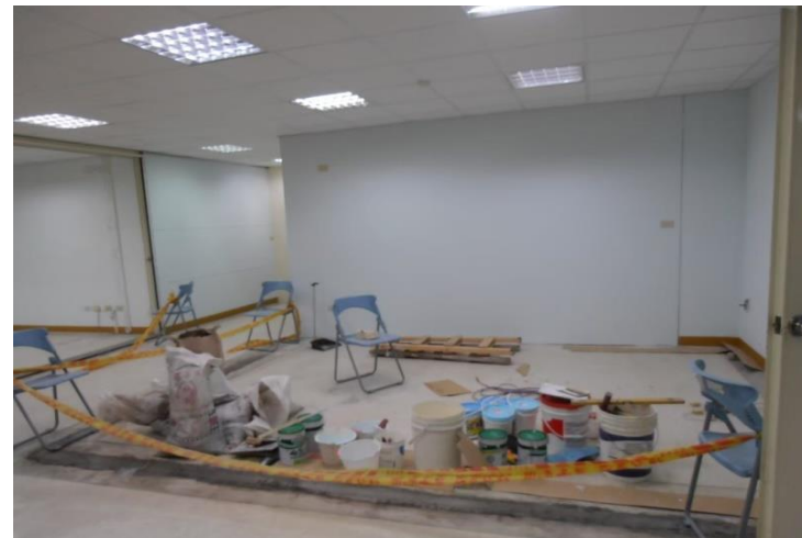
彰化縣埔心鄉衛生所施工