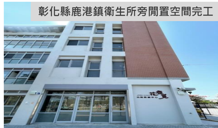
彰化縣鹿港鎮衛生所旁閒置空間完工