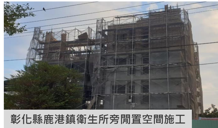
彰化縣鹿港鎮衛生所旁閒置空間施工