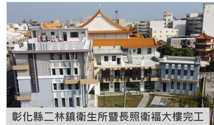
彰化縣二林鎮衛生所暨長照衛福大樓完工