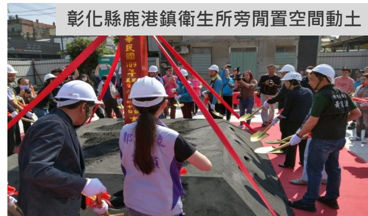
彰化縣鹿港鎮衛生所旁閒置空間動土