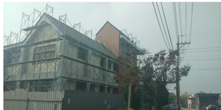
埔鹽鄉社會福利園區施工中