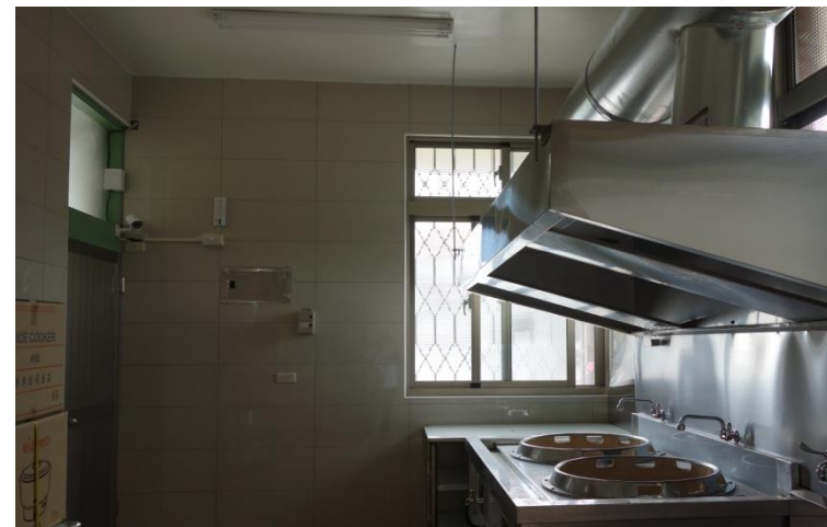
倡和社區活動中心內部環境整修完工