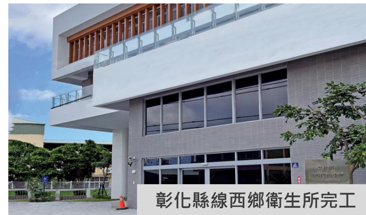
彰化縣線西鄉衛生所完工