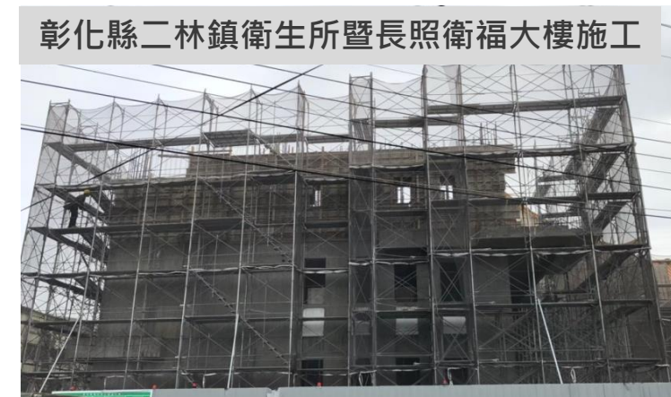
彰化縣二林鎮衛生所暨長照衛福大樓施工