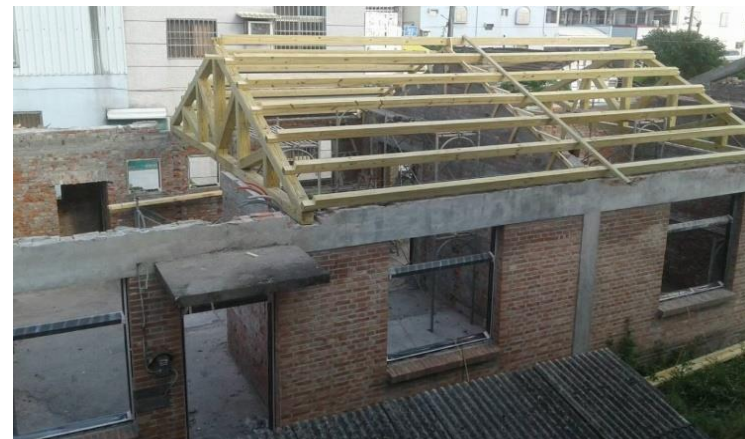
彰化縣竹塘鄉衛生所後棟施工