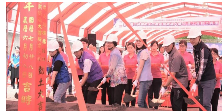
彰化縣二林鎮衛生所暨長照衛福大樓動土