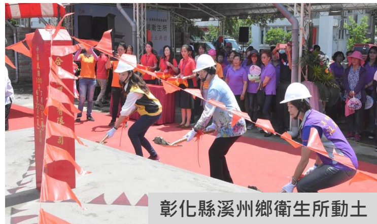
彰化縣溪州鄉衛生所動土