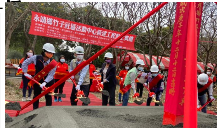
永靖鄉竹子社區活動中心新建工程動土