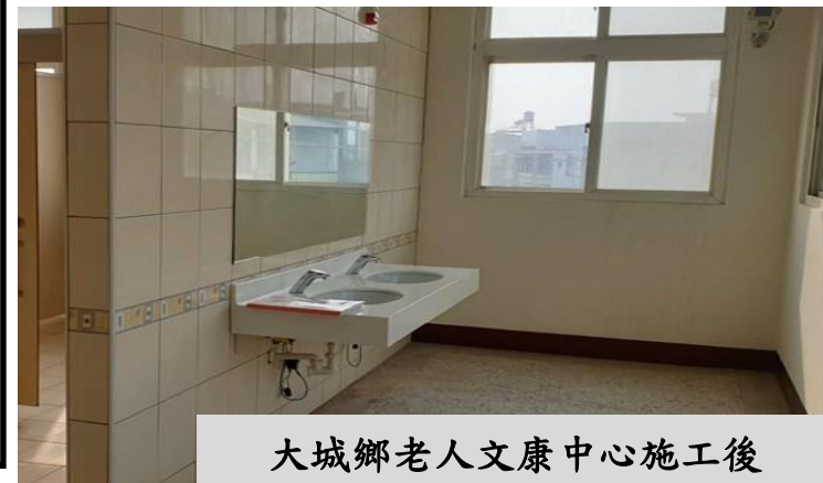
大城鄉老人文康中心施工後