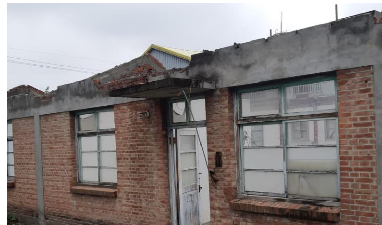
彰化縣竹塘鄉衛生所後棟原始照片