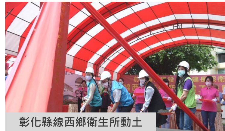
彰化縣線西鄉衛生所動土