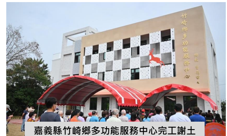
嘉義縣竹崎鄉多功能服務中心完工謝土