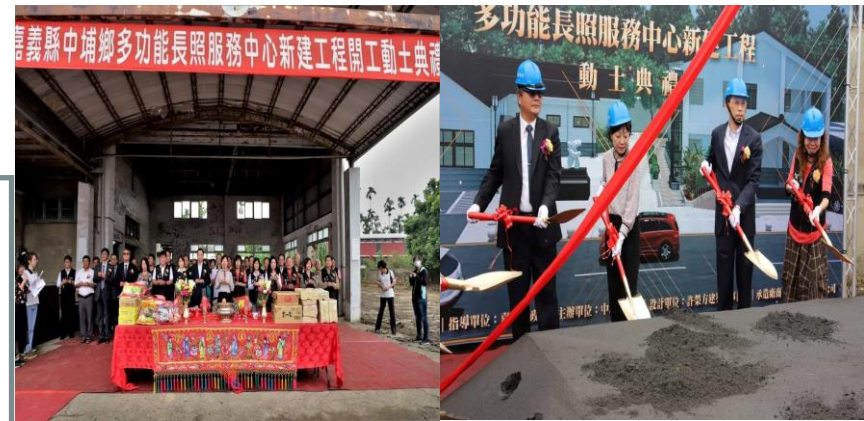
中埔鄉多功能長照中心動土典禮