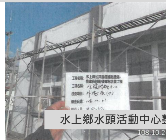
水上鄉水頭活動中心整建施工