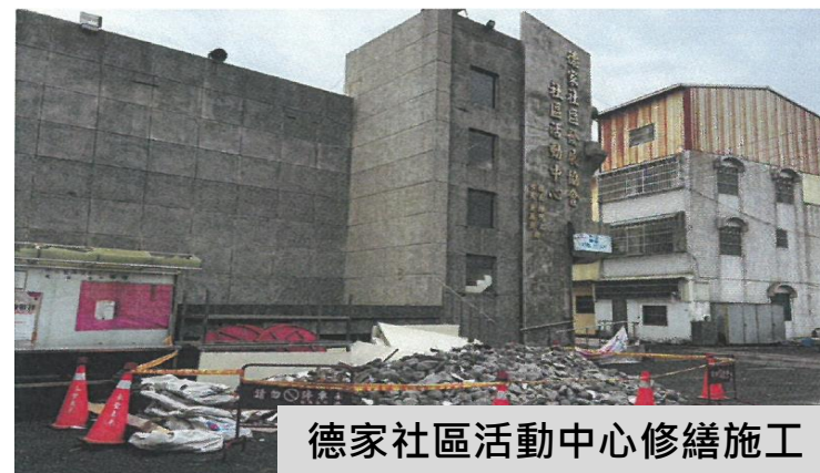
德家社區活動中心修繕施工