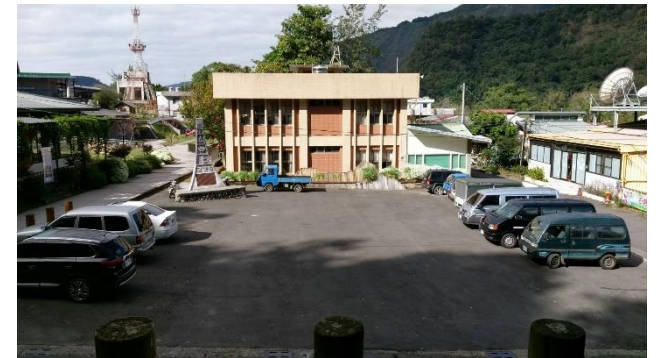
阿里山鄉舊圖書館