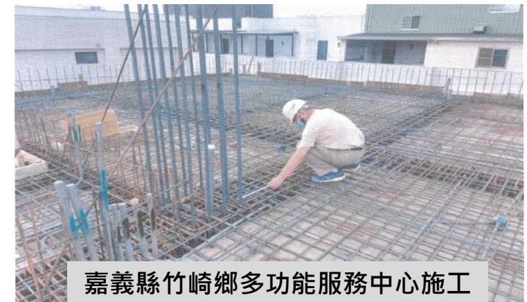
嘉義縣竹崎鄉多功能服務中心施工