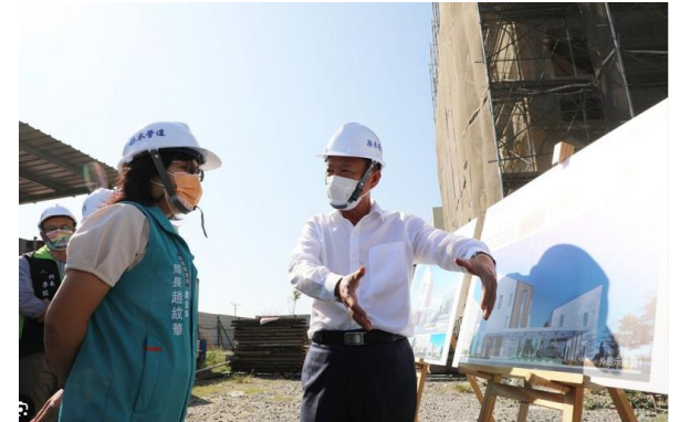
新港鄉衛生所施工視察