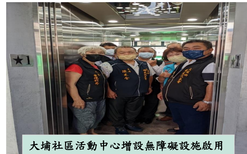
大埔社區活動中心增設無障礙設施啟用