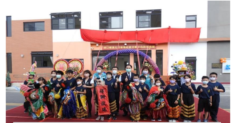
嘉義縣溪口鄉溪北後港社區活動中心落成典禮