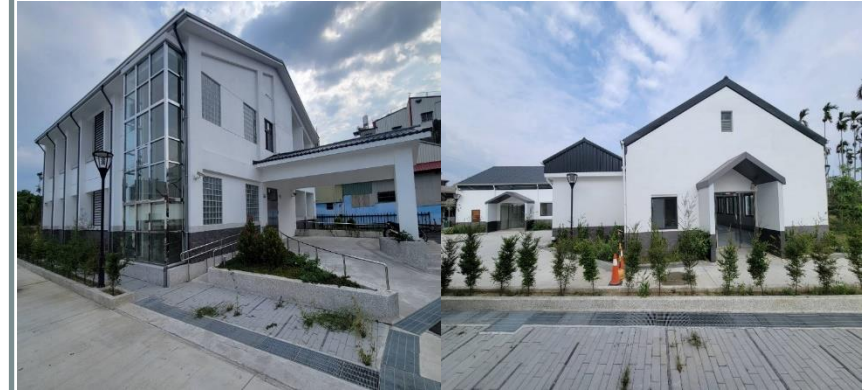
中埔鄉多功能長照中心完工