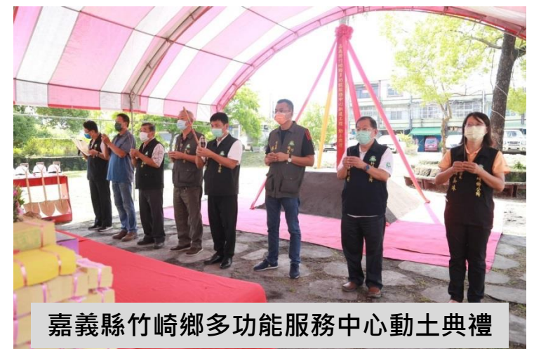
嘉義縣竹崎鄉多功能服務中心動土典禮