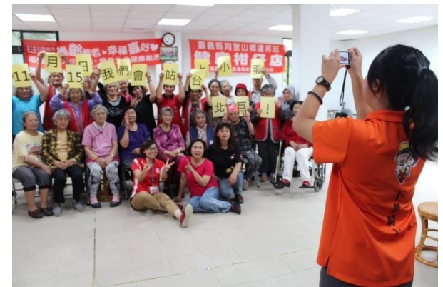
社照C+長者健康促進