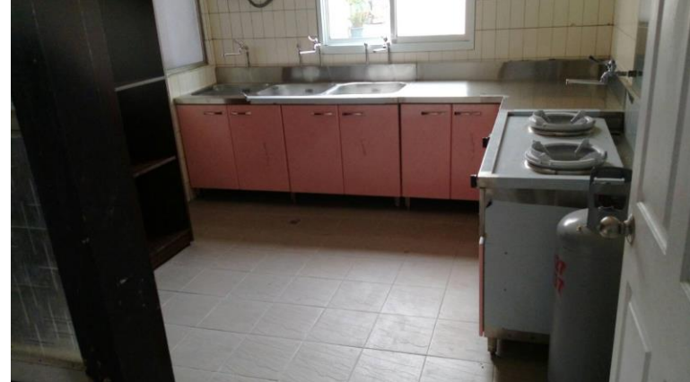
嘉義縣民雄鄉菁埔長照據點廚房地板磁磚施工