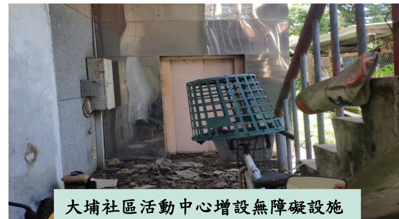
大埔社區活動中心增設無障礙設施