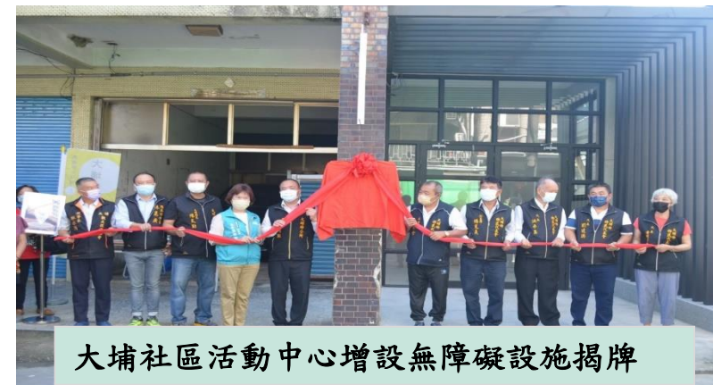
大埔社區活動中心增設無障礙設施揭牌