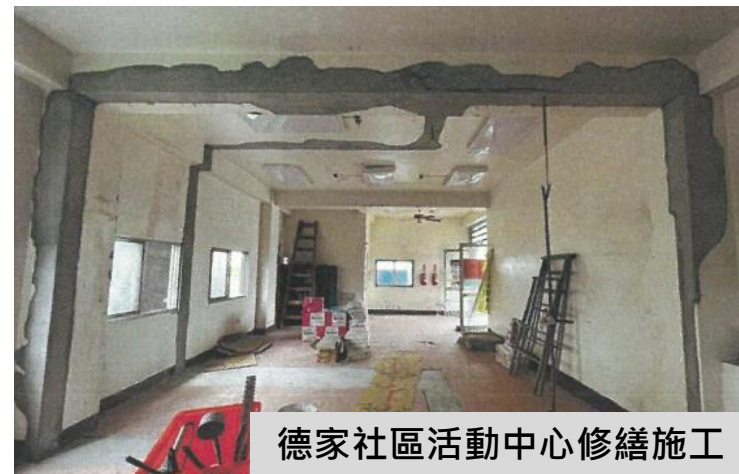
德家社區活動中心修繕施工