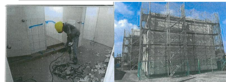
古林社區活動中心修繕施工