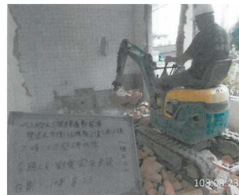
水上鄉水頭活動中心整建施工