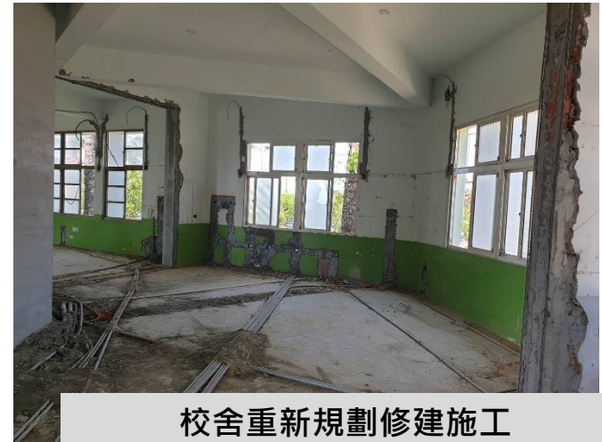
校舍重新規劃修建施工