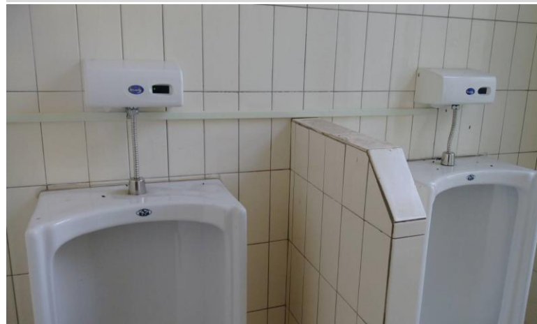
嘉義縣民雄鄉菁埔長照據點廁所施工