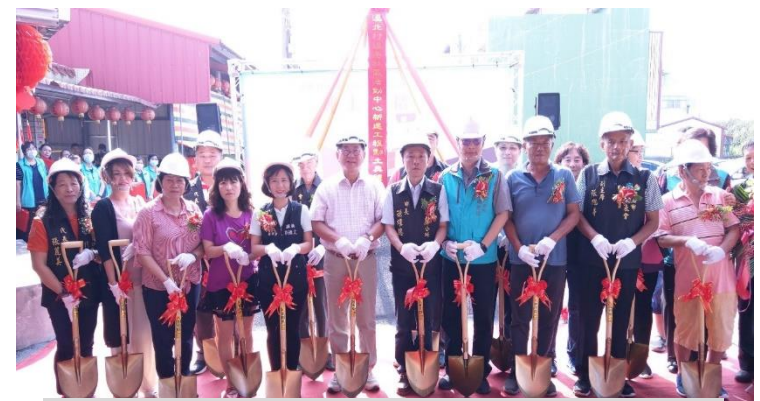
嘉義縣溪口鄉溪北後港社區活動中心動土典禮