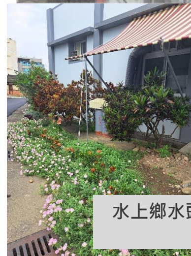
水上鄉水頭活動中心整建施工 完工