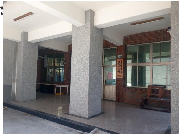
水牛厝社區活動修繕計畫完工後照片