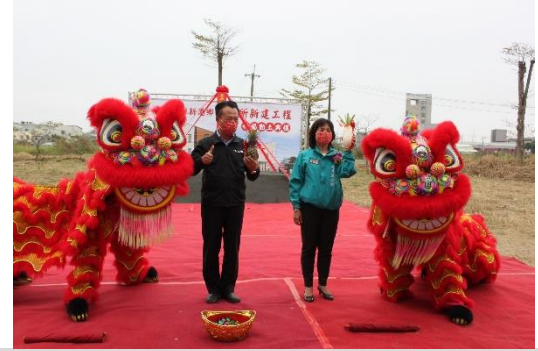
新港鄉衛生所動土典禮