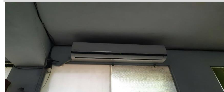
嘉義縣民雄鄉菁埔長照據點加裝冷氣設備