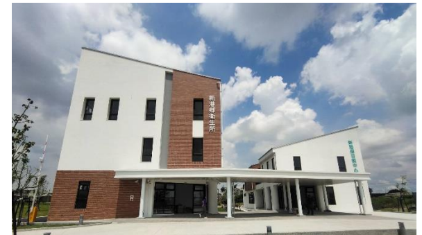
新港鄉衛生所竣工