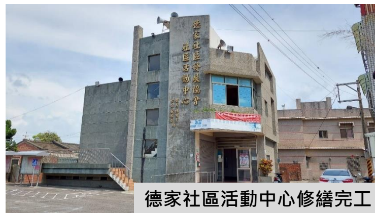
德家社區活動中心修繕完工