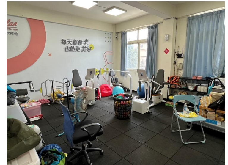
老人活動中心內不老活力中心