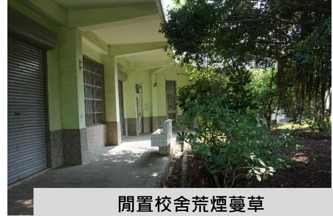
閒置校舍荒煙蔓草