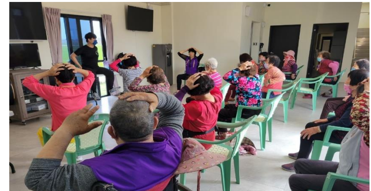
嘉義縣溪口鄉溪北後港社區活動中心活動照