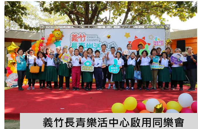
義竹長青樂活中心啟用同樂會