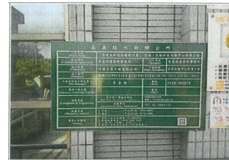
古林社區活動中心修繕施工