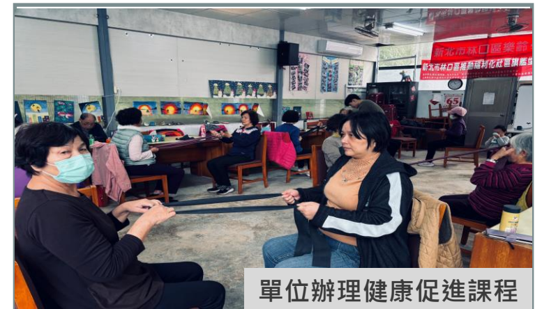
單位辦理健康促進課程