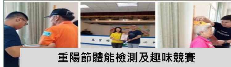
重陽節體能檢測及趣味競賽