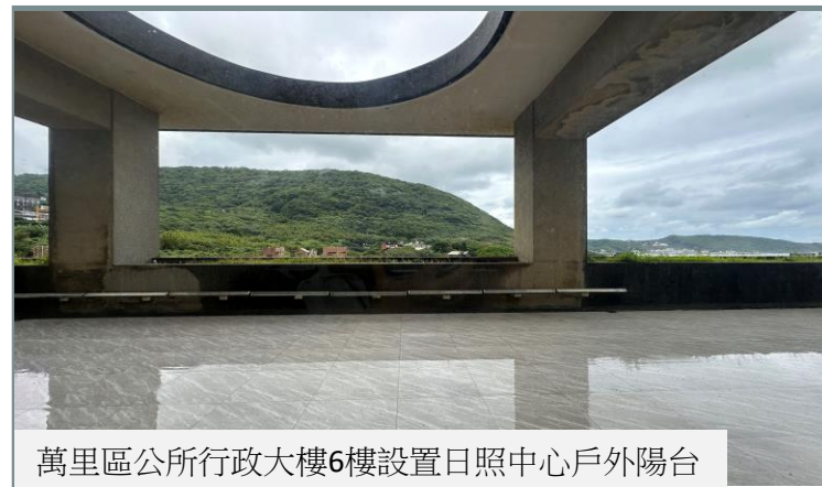
萬里區公所行政大樓6樓設置日照中心戶外陽台