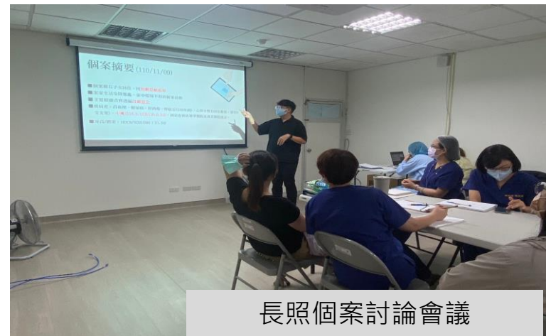
長照個案討論會議