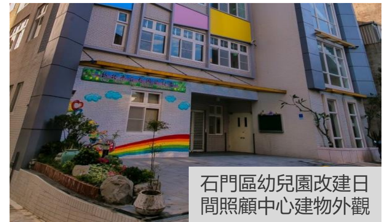
石門區幼兒園改建日間照顧中心建物外觀