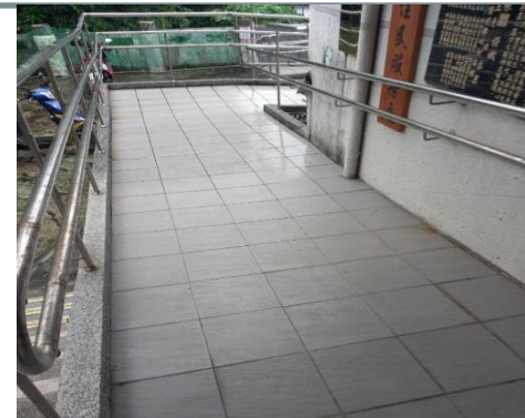
整建後之無障礙斜坡