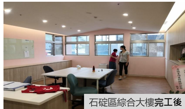
石碇區綜合大樓完工後