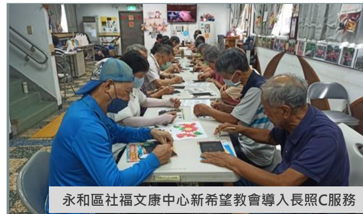
永和區社福文康中心新希望教會導入長照C服務