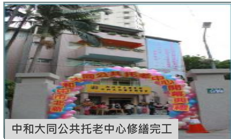
中和大同公共托老中心修繕完工