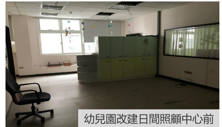
幼兒園改建日間照顧中心前