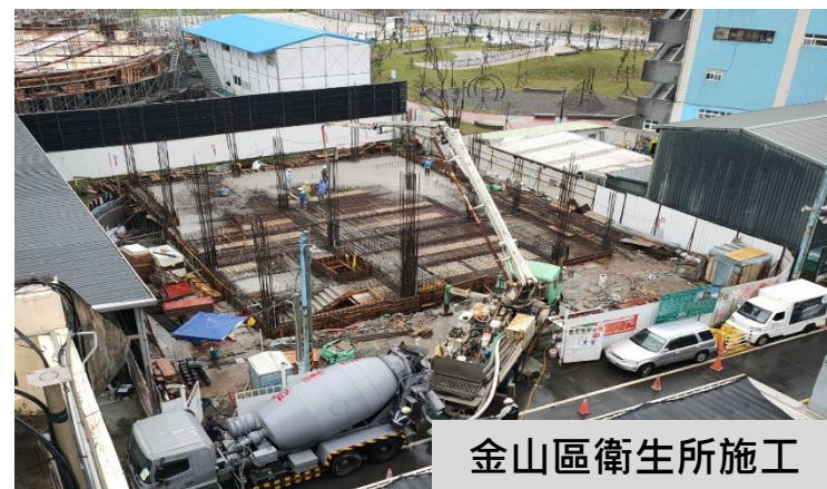
金山區衛生所施工