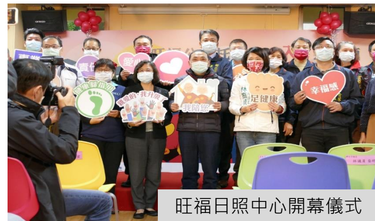
旺福日照中心開幕儀式