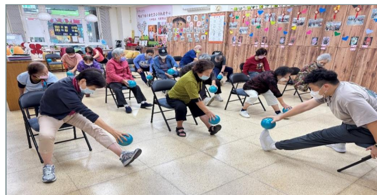
金山區藝文暨老人活中心介惠基金會導入長照C服務