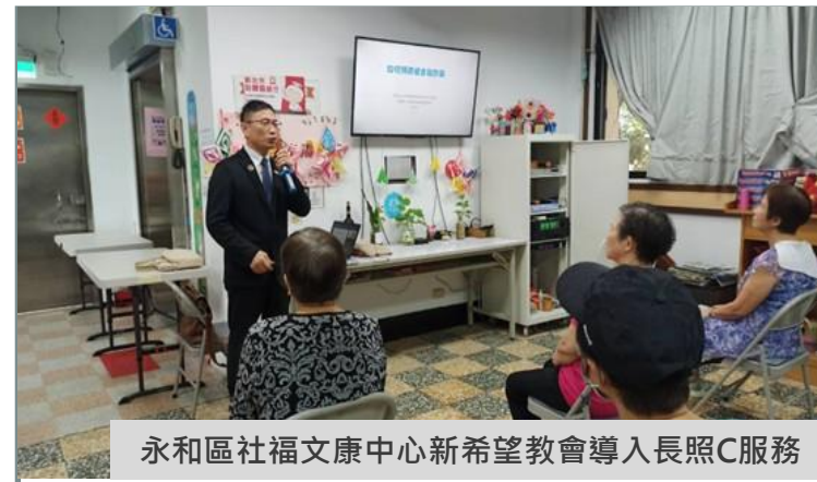
永和區社福文康中心新希望教會導入長照C服務