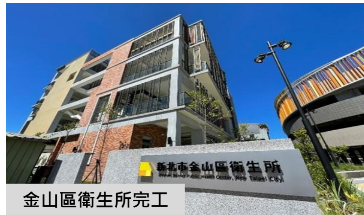
金山區衛生所完工