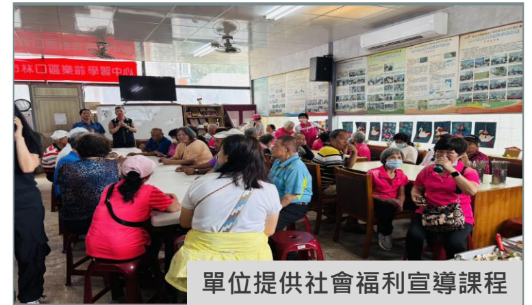
單位提供社會福利宣導課程