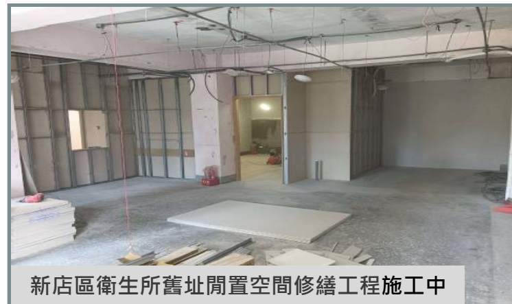
新店區衛生所舊址閒置空間修繕工程施工中