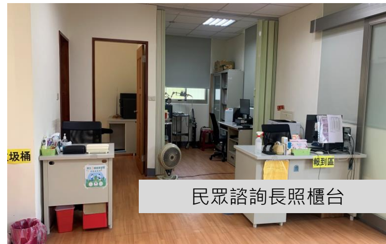
民眾諮詢長照櫃台