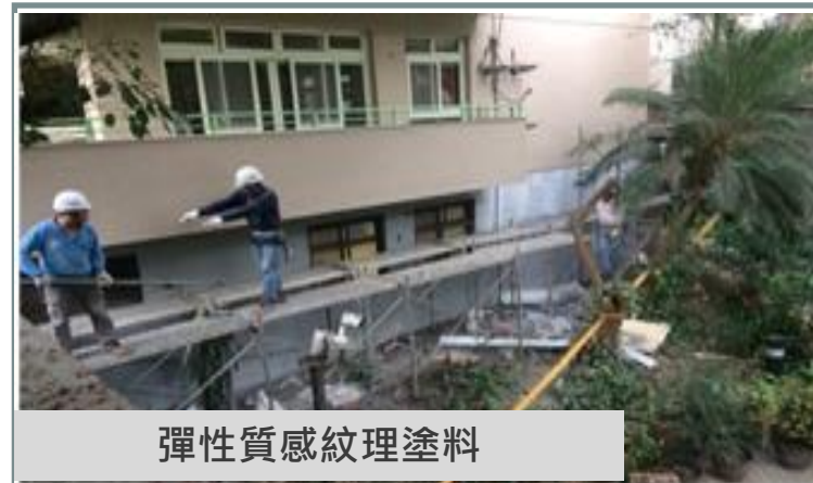
彈性質感紋理塗料