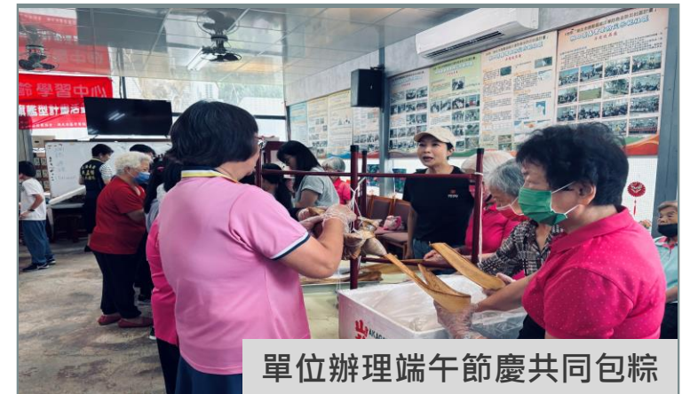
單位辦理端午節慶共同包粽