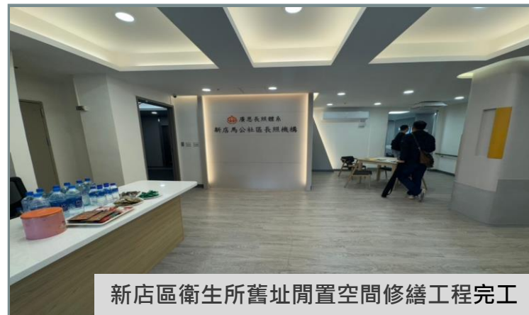
新店區衛生所舊址閒置空間修繕工程完工