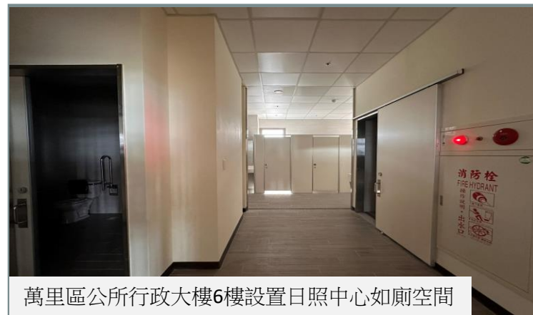
萬里區公所行政大樓6樓設置日照中心如廁空間