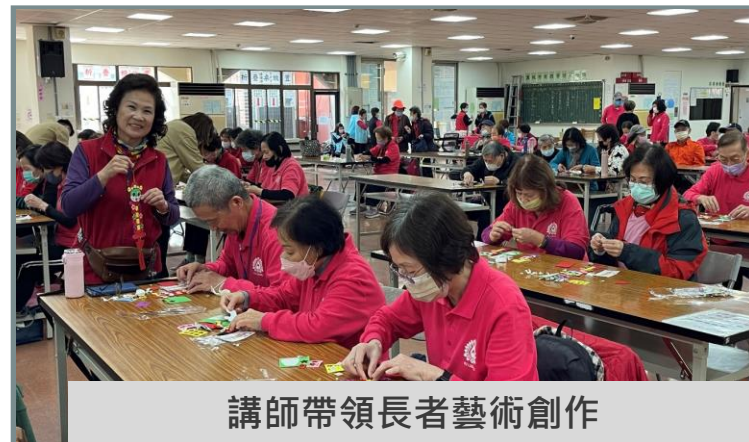
講師帶領長者藝術創作