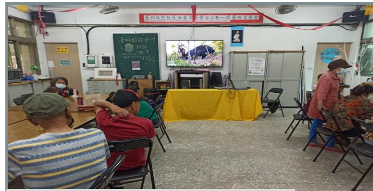
單位辦理生態保育影片賞析