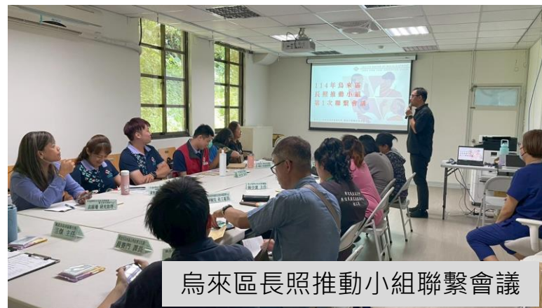
烏來區長照推動小組聯繫會議