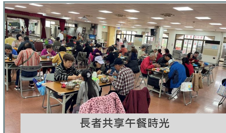
長者共享午餐時光