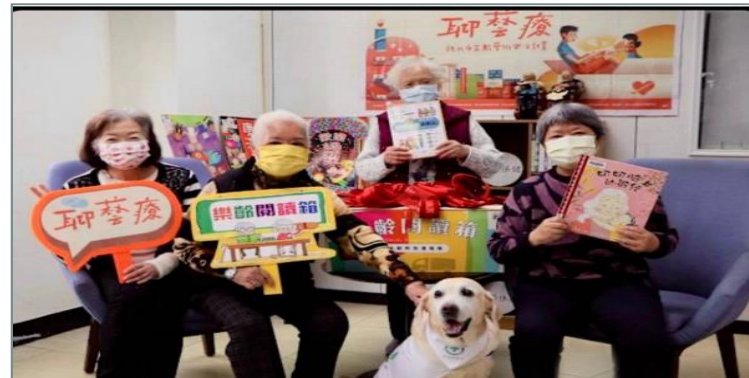
狗醫生至據點一起樂齡伴讀