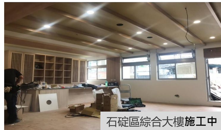
石碇區綜合大樓施工中