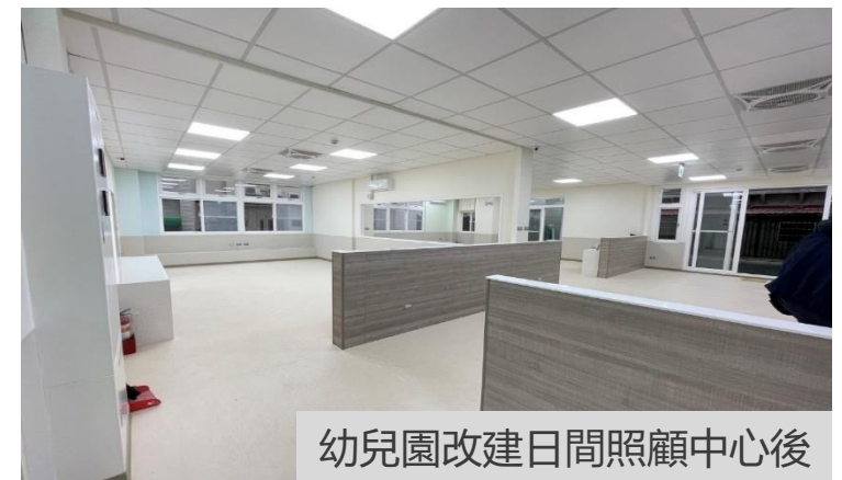
幼兒園改建日間照顧中心後