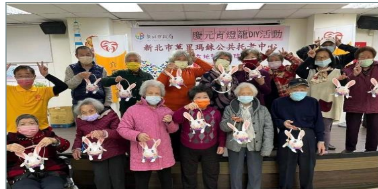
長者體驗燈籠DIY活動