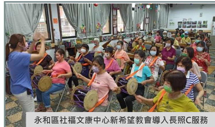
永和區社福文康中心新希望教會導入長照C服務