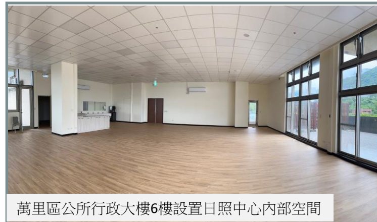
萬里區公所行政大樓6樓設置日照中心內部空間