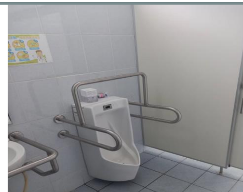
整建後之無障礙廁所