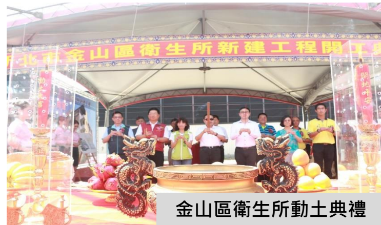
金山區衛生所動土典禮