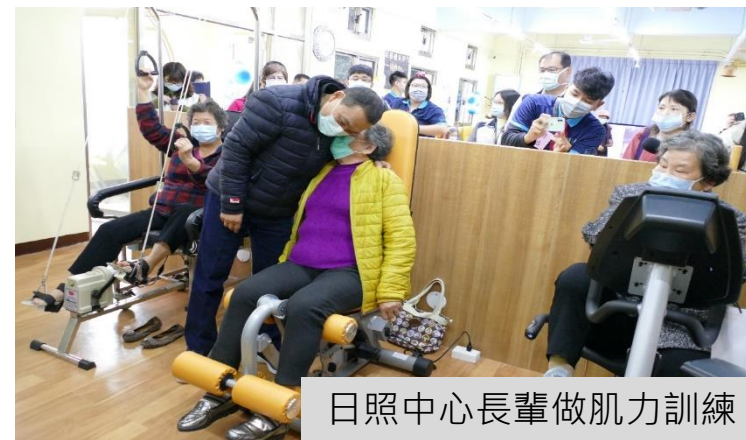
日照中心長輩做肌力訓練