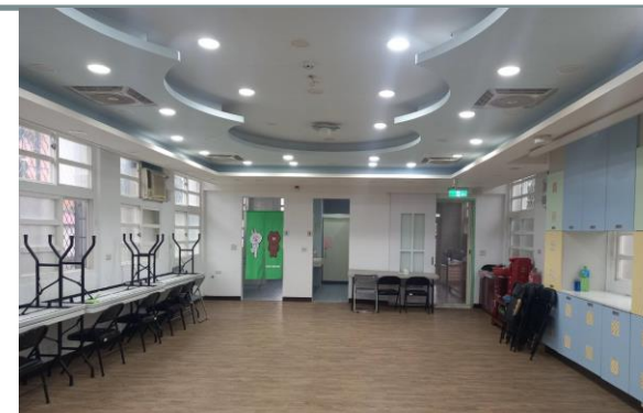
整建後之活動空間