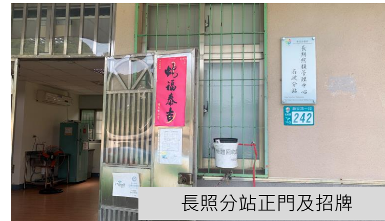
長照分站正門及招牌