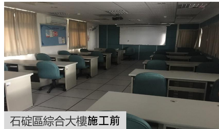
石碇區綜合大樓施工前