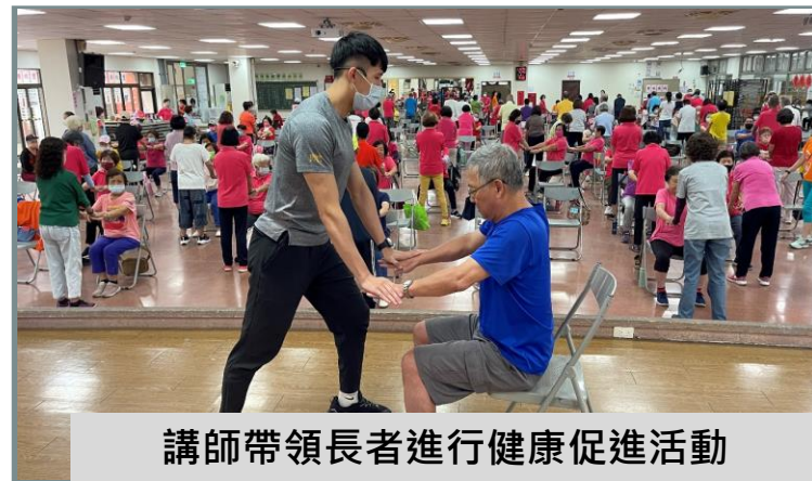
講師帶領長者進行健康促進活動