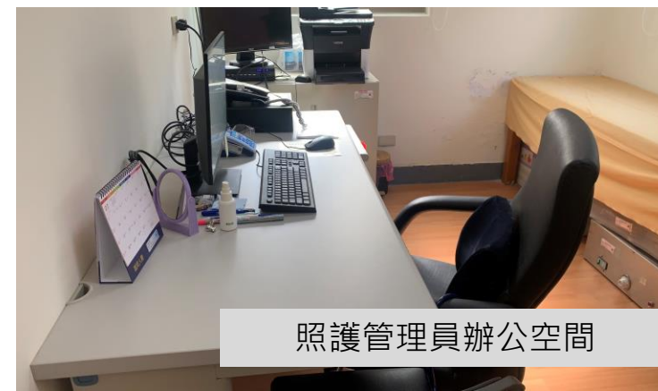
照護管理員辦公空間