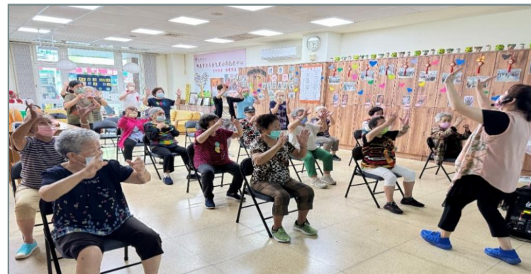
金山區藝文暨老人活中心介惠基金會導入長照C服務