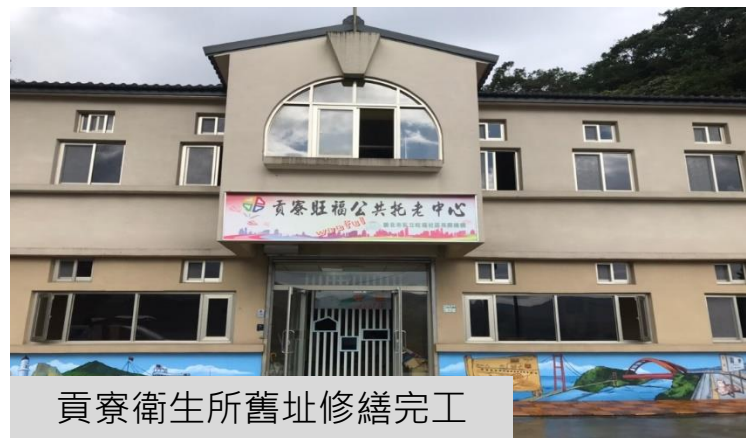
貢寮衛生所舊址修繕完工