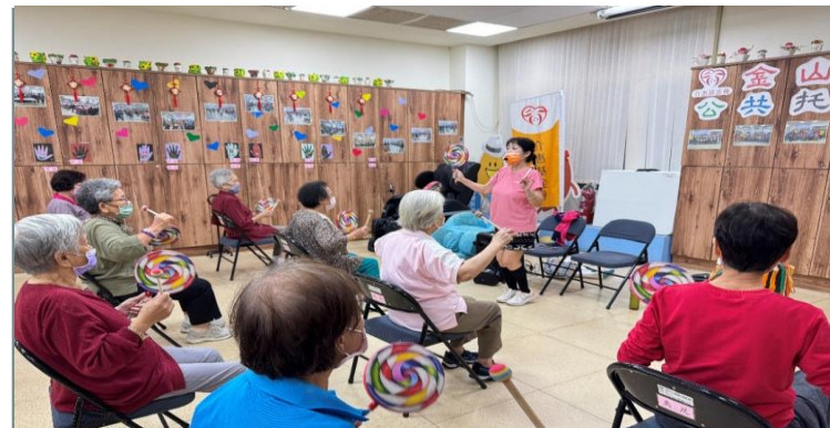
金山區藝文暨老人活中心介惠基金會導入長照C服務