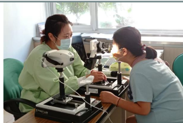
會診前進行相關眼科檢查