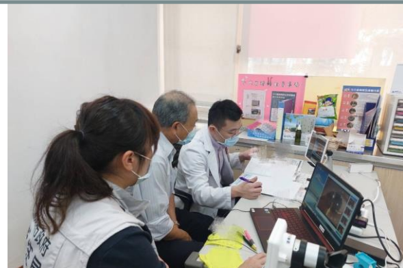
實驗場域遠距會診情形